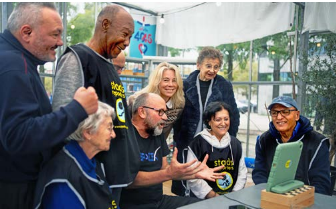
De wijk in voor verhalen.