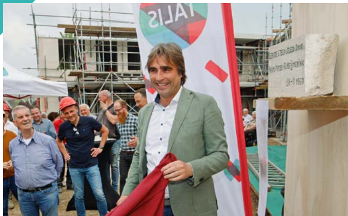
Onthulling eerste steen bij de nieuwbouw van Jerusalem.