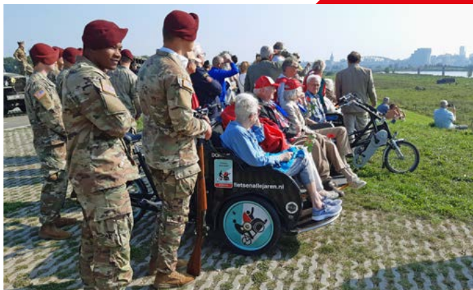
Herdenking bevrijding Nijmegen.