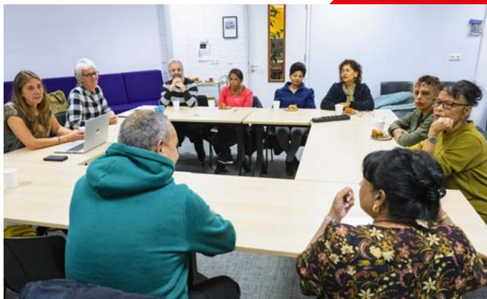
Bewoners met Talis in gesprek over de mogelijkheden.