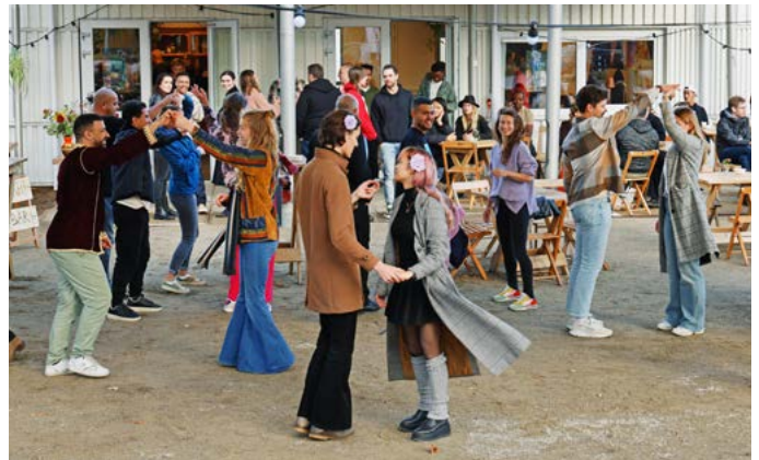
Bewoners tijdens de opening van NDW21.

Woont u in Neerbosch-Oost en wilt u Stadsreporter worden? Iedereen die wil bijdragen aan meer verbinding in de wijk kan meedoen, ervaring is niet nodig. Stuur (vrijblijvend) een mail naar nijmegen@stadsreporters.nl . Meer weten? Kijk op: www.stadsreporters.nl .