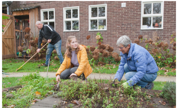
Vrijwilligers en een stagiair van de Broederij aan het werk.

De meeste werkzaamheden zijn onderhoudswerkzaamheden. Voor een deel van de werkzaamheden is nog goedkeuring nodig van de huurders.