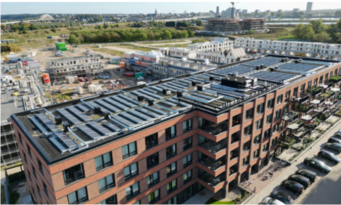
Zonnepanelen op wooncomplex Aaron in Oosterhout.

lager en kan het zomaar zo zijn dat u nu wel recht heeft op huurtoeslag. Terwijl dat daarvoor niet zo was. Voor de energietoeslag (die geldt voor iedereen met een inkomen tot 120 procent van het sociaal minimum) kunt u terecht bij de gemeente.