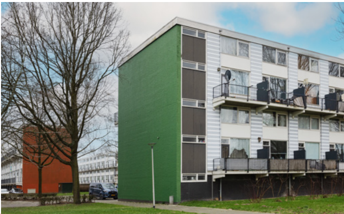
De maisonnettes zien er binnenkort weer helemaal fris uit.