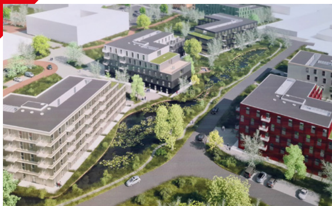
Een impressie van NDW21 aan de Nieuwe Dukenburgseweg.

Heeft u interesse in een AED-apparaat in uw buurt óf wilt u als donateur of vrijwilliger uw steentje bijdragen? Kijk dan op: www.hartslagnijmegen.nl . Aanmelden als hulpverlener kan via het reanimatie oproepsysteem www.hartslagnu.nl .