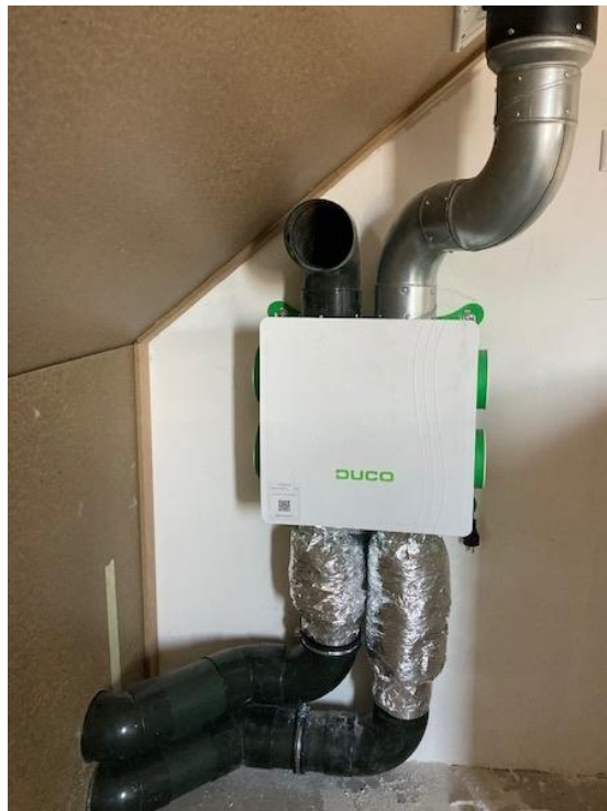
Op de tweede verdieping bevindt zich de unit voor mechanische ventilatie

Op deze ventilatie-unit zijn kanalen aangesloten welke met een ventiel eindigen in het toilet, keuken/woonkamer en badkamer. Deze ventielen zijn ingeregeld zodat de juiste hoeveelheid lucht per ruimte wordt afgezogen. Let op bij het schoonmaken dat u de plaatsing van de ventielen niet wijzigt; daarmee ontregelt u het systeem.