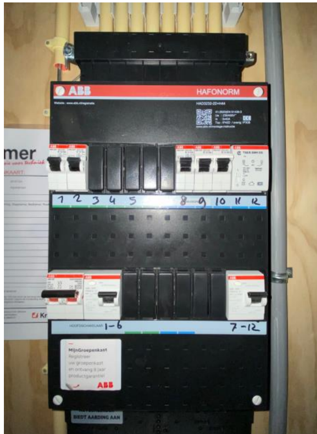
In de meterkast hangt de groepenkast met links daarnaast informatie over de indeling

hoofdkranen moet zijn. Welk stopcontact op welke groep is aangesloten kunt u vinden in de groepindelings-informatie in uw meterkast.