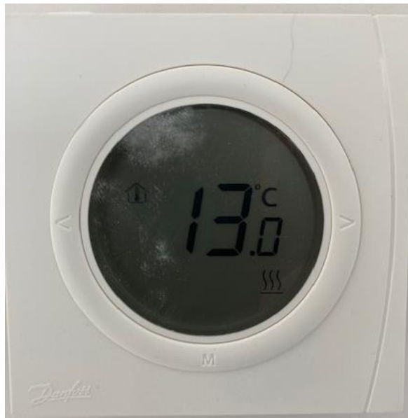
De thermostaat hangt in de woonkamer

Voor meer informatie kunt u bellen met Vattenfall via telefoonnummer 0900-0808.