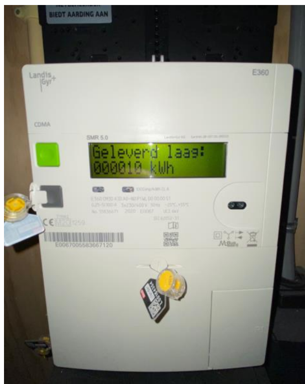
In de meterkast hangt de elektrameter. Door op de groene knop naast het schermje te drukken kunt u uw meterstanden aflezen.