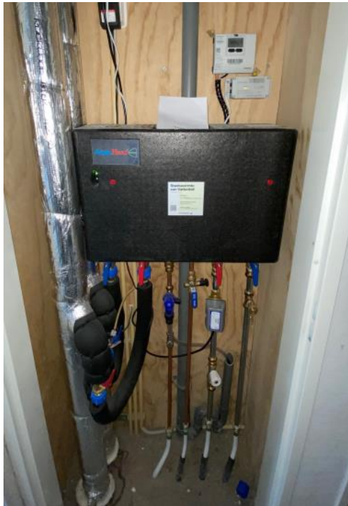
In de meterkast bevindt zich de stadsverwarmings-unit

Voor een goede werking van de radiatoren moet de ruimte rondom de radiatoren vrij zijn. U kunt dus beter geen meubels voor de radiator plaatsen of lange gordijnen voor de radiatoren hangen. Pas ook op met drogen van wasgoed op de radiatoren, de radiatoren kunnen hiervan gaan roesten.