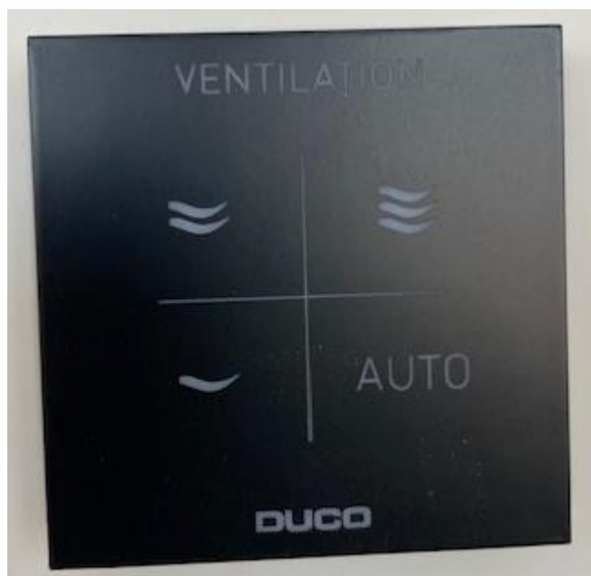
In de woonkamer hangt de hoofdbediening van de mechanische ventilatie

Op deze ventilatie-unit zijn kanalen aangesloten welke met een ventiel eindigen in het toilet, keuken/woonkamer en badkamer. Deze ventielen zijn ingeregeld zodat de juiste hoeveelheid lucht per ruimte wordt afgezogen. Let op bij het schoonmaken dat u de plaatsing van de ventielen niet wijzigt; daarmee ontregelt u het systeem.