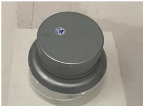
In de keuken hangt de aansluiting voor een afzuigkap

In verband met de stadsverwarming is alleen elektrisch koken mogelijk in de woning. Hiervoor zit er een perilex aansluiting van 2x230V.