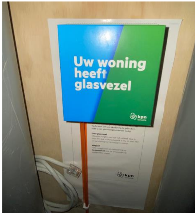
In de meterkast zit de aansluiting voor glasvezel