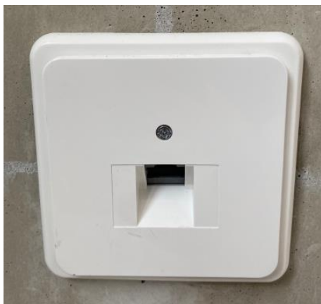
In de woonkamer zitten diverse bedrade data-punten voor bijvoorbeeld de tv-aansluiting