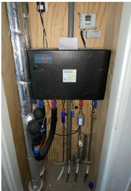
In de meterkast bevindt zich de stadsverwarmings-unit.

Gebruik deze niet als opbergkast en houd de meterkast vrij van spullen. Dit is vooral bij calamiteiten heel belangrijk omdat men dan snel bij uw elektragroepen of hoofdkranen moet zijn. Welk stopcontact op welke groep is aangesloten kunt u vinden in de groepindelings-informatie in uw meterkast.