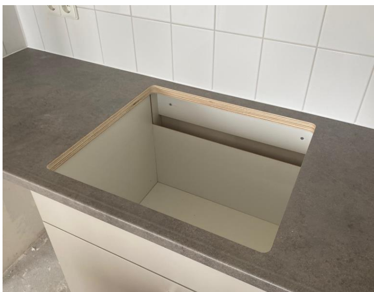
In het aanrecht is een uitsparing weggelaten voor het plaatsen van een inductiekookplaat

In verband met de stadsverwarming is alleen elektrisch koken mogelijk in de woning. Hiervoor zit er een perilex aansluiting van 2x230V.