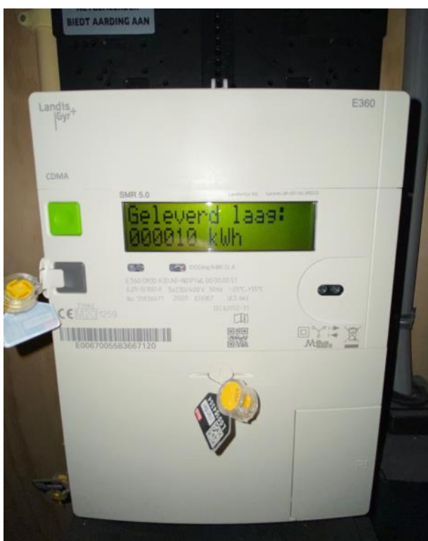
In de meterkast hangt de elektrometer. Door op de groene knop naast het schermje te drukken kunt u uw meterstanden aflezen.