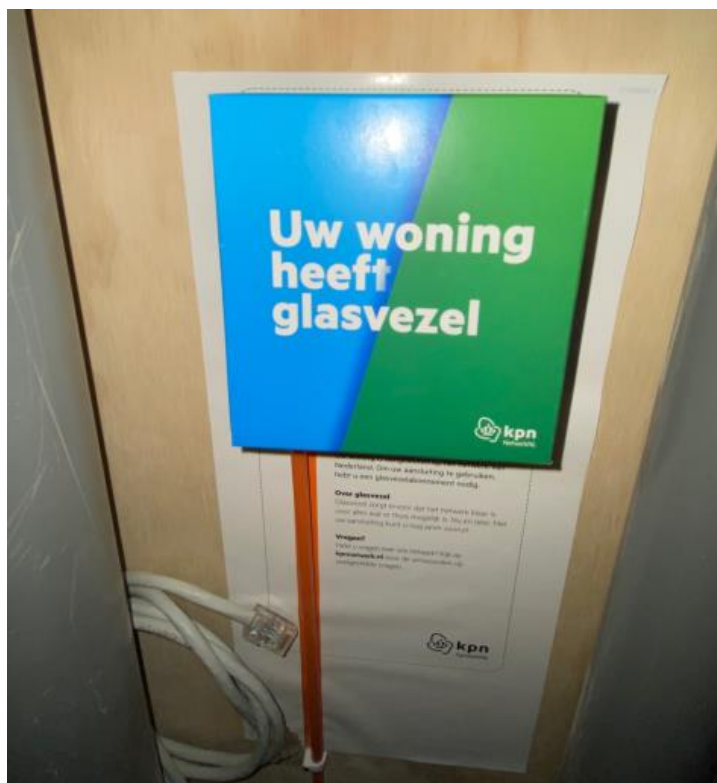
In de meterkast zit de aansluiting voor glasvezel

Op de website vindt u een filmpje met de locatie van de glasvezelkabel.