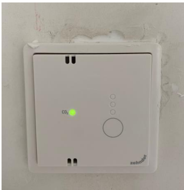
In de woonkamer hangt de hoofdbediening van de mechanische ventilatie

Uw woning is voorzien van een energiezuinig mechanisch ventilatiesysteem dat ervoor zorgt dat de vochtige vervuilde lucht wordt afgezogen. De ventilatie-unit hangt in de kast op de slaapkamer (en bij de woningen type C in de hal). Op deze ventilatie-unit zijn kanalen aangesloten welke met een ventiel eindigen in het toilet, keuken/woonkamer en badkamer. Deze ventielen zijn ingeregeld zodat de juiste hoeveelheid lucht per ruimte wordt afgezogen. Let op bij het schoonmaken dat u de plaatsing van de ventielen niet wijzigt; daarmee ontregelt u het systeem.