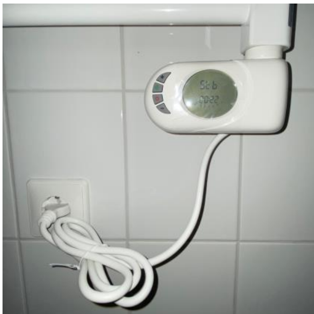
In de badkamer hangt een elektrische radiator.

Op de website vindt u een filmpje met uitleg over de verschillende radiatoren.