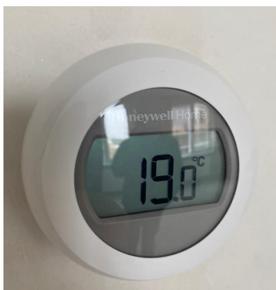
De thermostaat hangt in de woonkamer

Houdt u er rekening mee dat het eerste jaar de stookkosten tot 25% hoger zijn dan in de toekomst, dit komt door al het aanwezige vocht in de nieuwbouwwoning. Om voordelig en comfortabel te stoken is het aan te raden dat u een constante temperatuur aanhoudt. Laat dus de thermostaat altijd op een zelfde basis-temperatuur staan, en wissel dit niet teveel af.