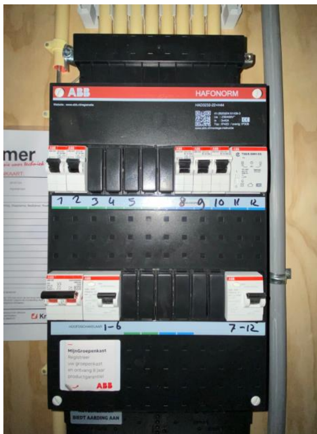
In de meterkast hangt de groepenkast met links daarnaast informatie over de indeling

De woning is bij oplevering aangesloten op het elektriciteitsnet, stadsverwarmingsnet en waternet. Benader nog voor de sleuteloverdracht een energieleverancier om een leveringscontract af te sluiten. Hiermee voorkomt u dat u wordt afgesloten.