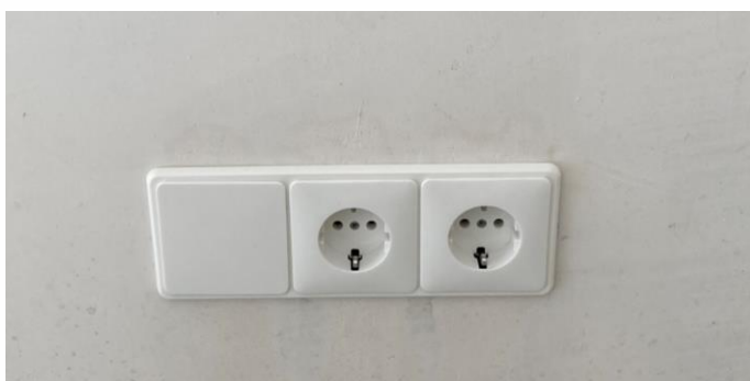
Aan de linkerkant zit de loze leiding

In de woning bevinden zich enkele loze leidingen.