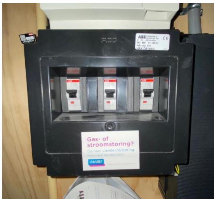
In de meterkast bevinden zich de hoofdschakelaars.

Er zitten twee kasten naast elkaar; de linker is voor de stadsverwarmingsunit met bijbehorende meter, de rechter voor elektra, water, glasvezel, de groepenkast en hoofdschakelaars. In de appartementen type D is dat precies andersom. Bij type B is er maar één meterkast.