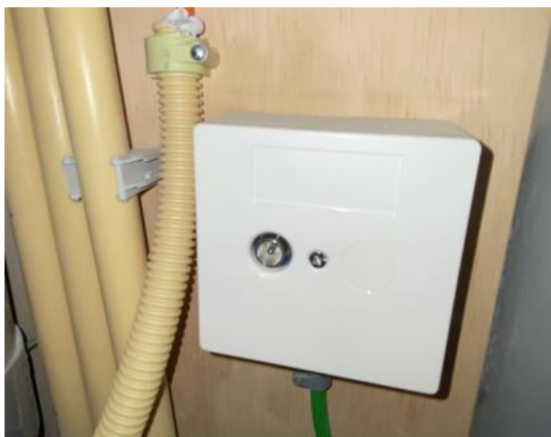
In de meterkast zit de CAI-aansluiting

In de meterkast is een dubbele wandcontactdoos gemonteerd. Deze kunt u bijvoorbeeld gebruiken voor routers. In de meterkast zijn verder nog een CAI-aansluiting en de glasvezelaansluiting aanwezig. U kunt één van deze aansluitingen kiezen om uw telefoon, internet, TV en radio te regelen. Zie verderop in dit document.