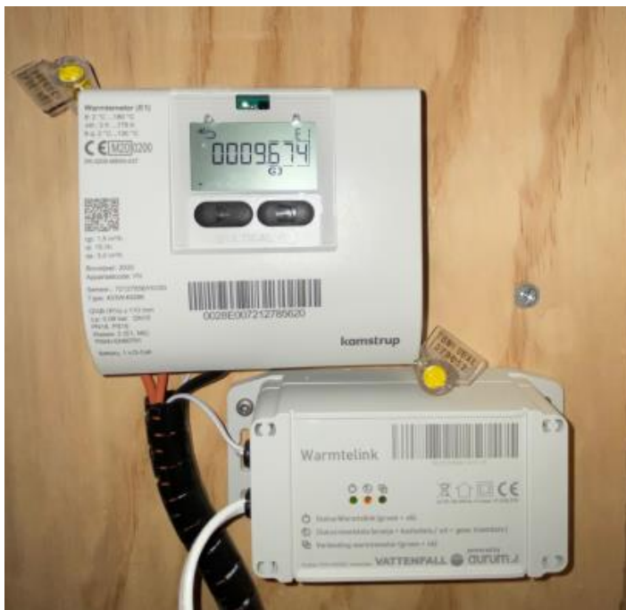
In de meterkast hangt boven de stadsverwarmings-unit de GJ-meter voor het registreren van de warmte en warmwatervraag.