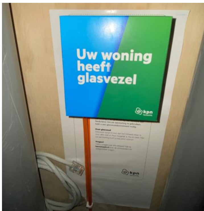
In de meterkast zit de aansluiting voor glasvezel