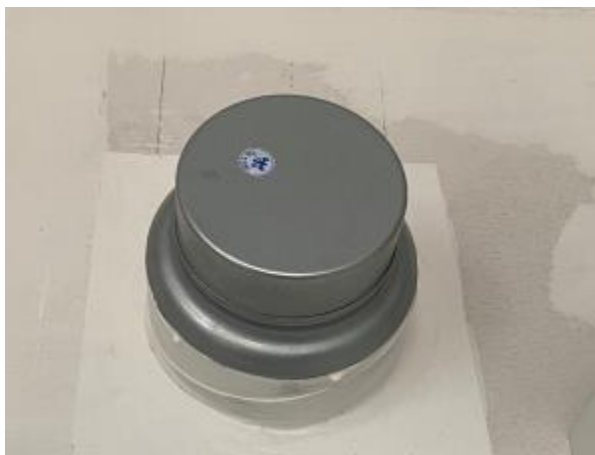
In de keuken hangt de aansluiting voor een afzuigkap

In verband met de stadsverwarming is alleen elektrisch koken mogelijk in de woning. Hiervoor zit er een perilex aansluiting van 2x230V.