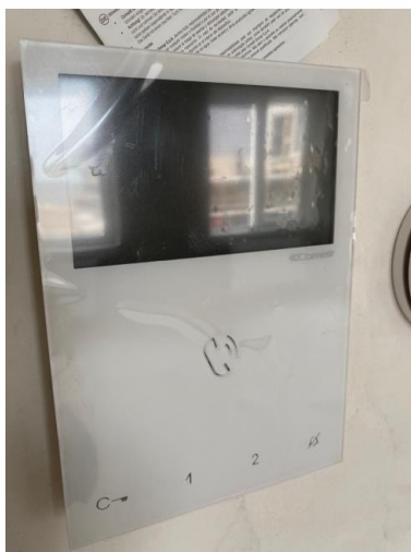
In de woonkamer hangt de videfoon

Als er mensen bij de algemene toegangsdeur bij u aanbellen, kunt u de deur openen met de videfoon in uw woonkamer.