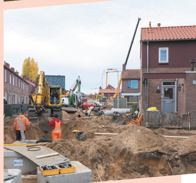
Kolpingstraat november 2018