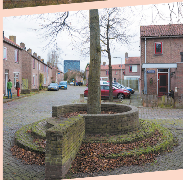
Kolpingstraat november 2017