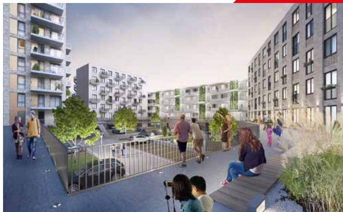
Impressie van het woongebouw, met 324 appartementen.