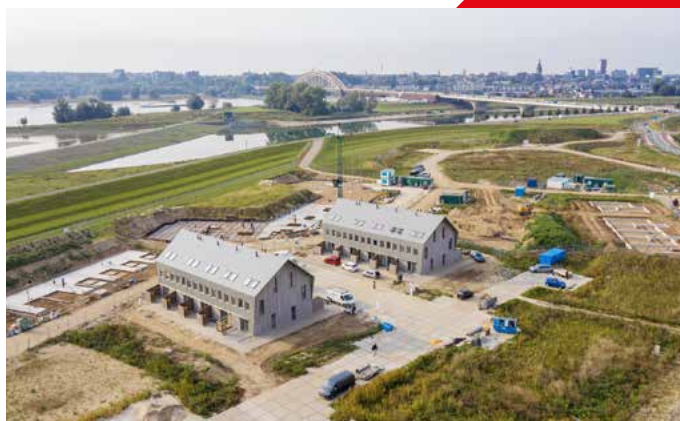
De nieuwe woningen gezien vanuit de lucht.