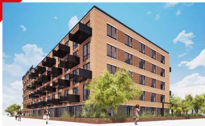
Bijzonder project voor mensen die zorg nodig hebben.

We kijken ernaar uit om de komende jaren nog veel meer woningen op te leveren in Nijmegen-Noord.