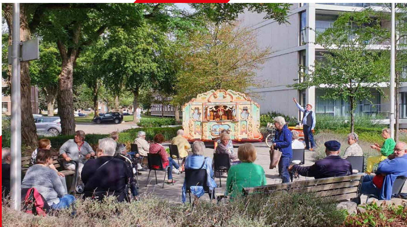
Dit najaar konden bewoners gezellig samen zijn bij het draaiorgel bij hun woongebouw.