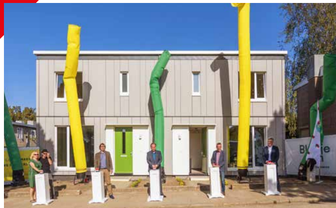
Binnen zes weken werden de nieuwe woningen gebouwd.

De sociale huurappartementen variëren in grootte van 43 tot 80 vierkante meter. Er komen 57 studio's met een ruimte voor wonen en slapen. Daarnaast komen er 20 appartementen met een slaapkamer. Op de begane grond komen bergingen, een grote fietsstalling en 35 parkeerplaatsen voor de huurders van Talis. De appartementen worden naar verwachting begin 2023 opgeleverd. Een paar maanden daarvoor start de verhuur via Entree.