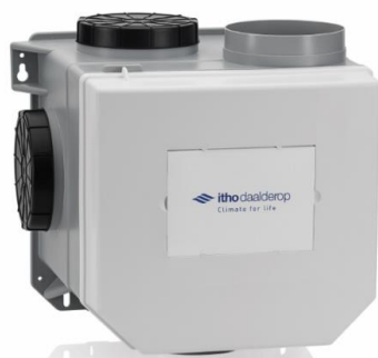
Afbeelding ventilatie box

Omdat wij uw woning beter isoleren, wordt het belangrijker dat u goed ventileert. Hierdoor blijft de lucht in uw woning fris en gezond. Om die reden plaatsen we een mechanische ventilatie box in uw woning. De volgende ruimtes krijgen mechanische afzuiging: de keuken, de badkamer en het toilet.