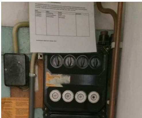
Foto voorbeeld oude groepenkast

We vervangen de eventueel aanwezige oude groepenkast (met porseleinen stoppen). Er komt een nieuwe groepenkast met schakelaars. In de groepenkast plaatsen we vier groepen en twee aardlekschakelaars. We controleren ook de veiligheid van de meterkast (gas en elektra).