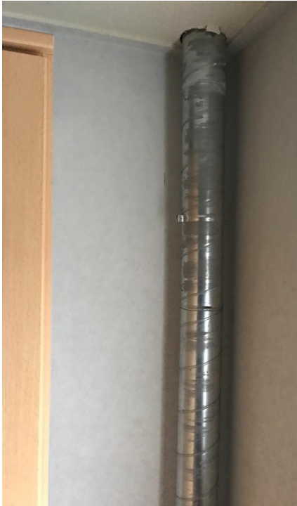
Foto buis zonder koof

Vanuit de vloering brengen we buizen aan naar de te ventileren ruimtes (badkamer, keuken en toilet). De buizen die in het zicht komen werken we af met een betimmering (koof) rondom de buizen. Hieronder ziet u hier een voorbeeld van.