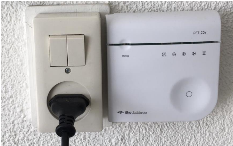
Afbeelding CO2 sensor (deze plaatsen we naast een bestaand stopcontact)

de lucht in uw woning en houdt u voldoende gezonde lucht in uw woning. De CO2 sensor plaatsen we in de woonkamer en in de hoofdslaapkamer.