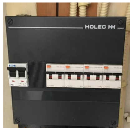
Foto voorbeeld nieuwe groepenkast