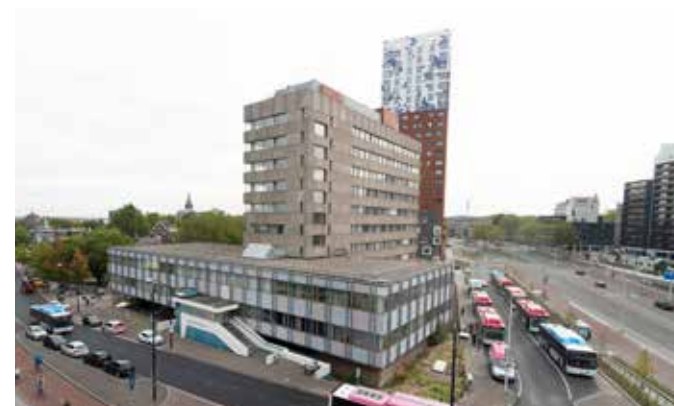
Binder, schuin tegenover Centraal Station Nijmegen.