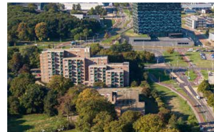
Een luchtfoto van Heydepark, op de hoek van het Goffertpark.