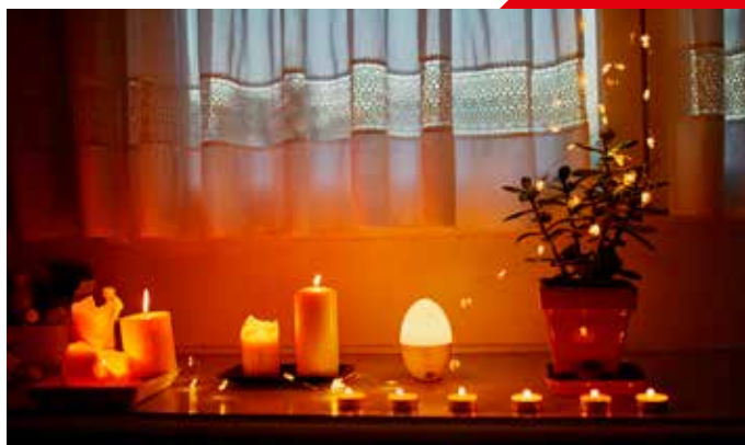
Overbelasting van stopcontacten en direct vuur kunnen brand veroorzaken.