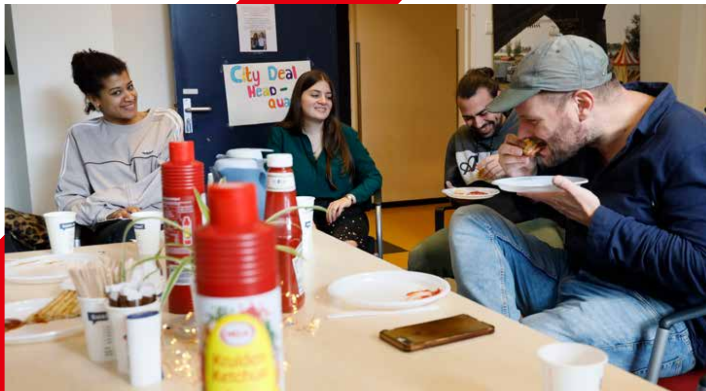
Bewoners lunchen samen tijdens de wekelijkse tosti-middag.