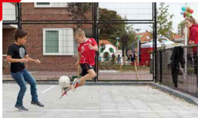
De Kolpingbuurt kreeg meer ruimte om te spelen.

Kijk voor meer informatie op www.brandweer.nl .