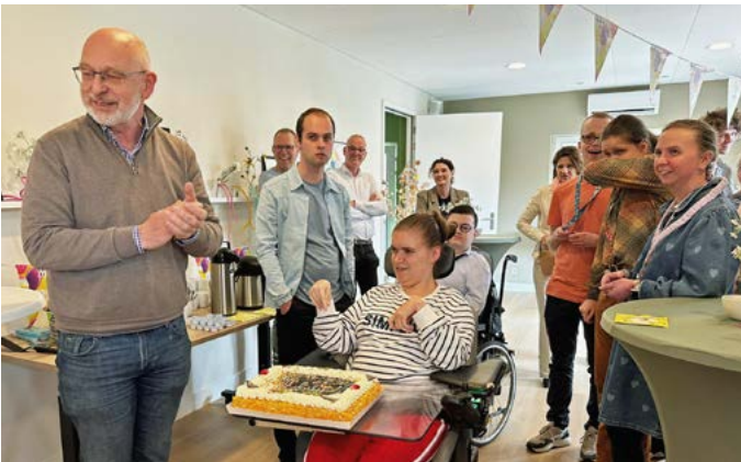
Gezelligheid bij WijSamen.