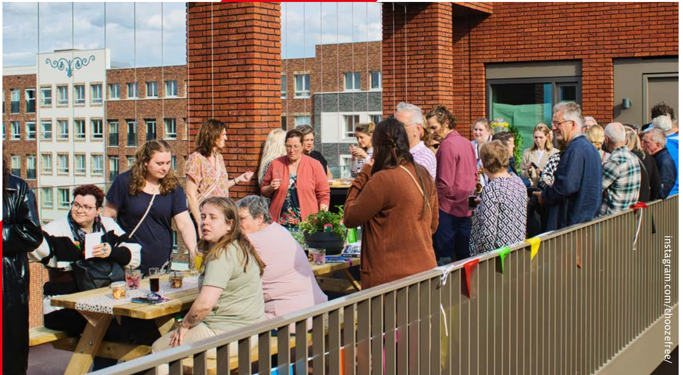
Kennismakingsfeest bij het complex Ellis in het Hart van de Waalsprong.