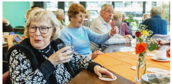
Bewoners van de Jadestraat in hun vernieuwde ontmoetingsruimte De Toermalijn.

ontmoetingsruimte kan heel bepalend zijn.” Om hierover te brainstormen werden creatieve sessies met de bewoners georganiseerd. Zo wilden zij in de ruimte graag meerdere hoekjes creëren in een huiselijker sfeer. Dat is uitstekend gelukt. In Nijmegen-Noord wordt een daktuin aangelegd op het gebouw, waar bewoners kunnen moestuinieren of borrelen.