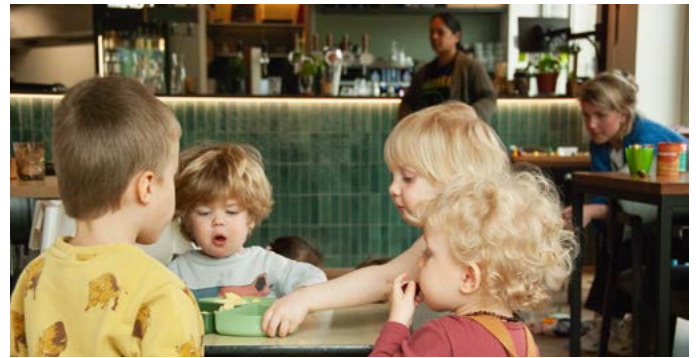
Koffie drinken bij BUUR West voor jong en oud.