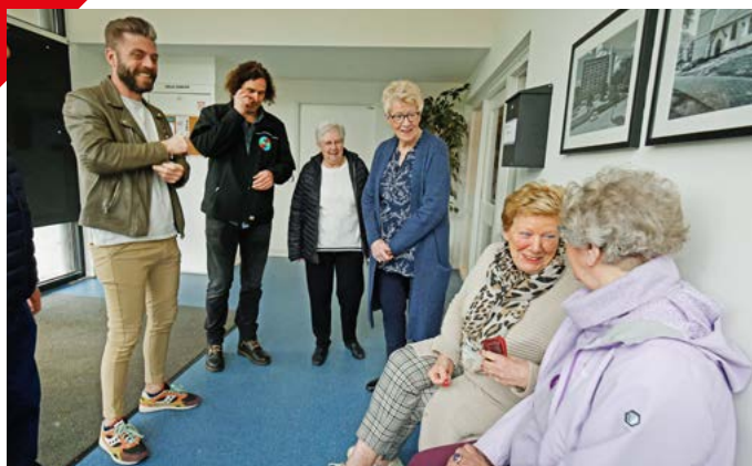
Bewoners van de Nocturneflat in gesprek over woonplezier.

Groen zorgt voor een koelere tuin en een koeler huis. Tegels en bestrating houden hitte lang vast. Met planten tegen de muur of een struik of boom voor uw huis, zorgt u voor extra schaduw. Ga lekker in de schaduw zitten en drink voldoende. Zo komt u de zomer wel door!