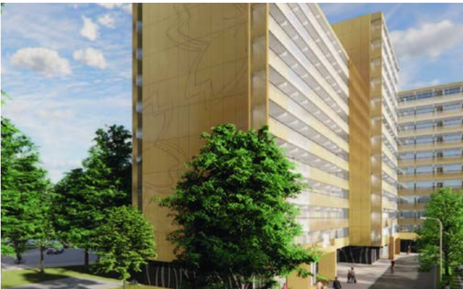
Impressie van de flats in Zwanenveld na het onderhoud.